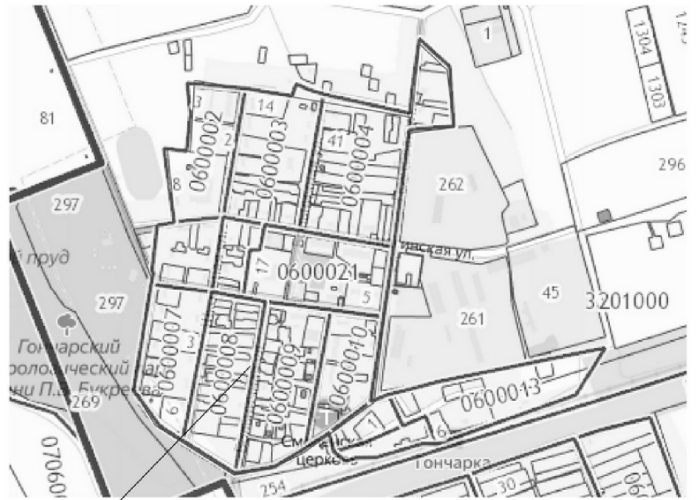
Схема зон с особыми условиями использования территории Схема размещения объектов культурного наследия