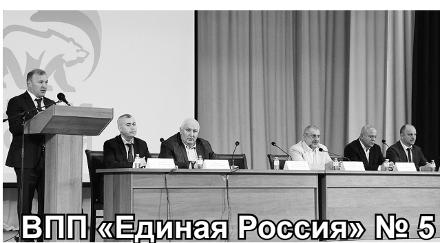
ВПП «Единая Россия» № 5

• ЛДПР предлагает снизить тарифы ЖКХ. Национализировать компании, которые завышают установленные законом тарифы.