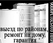
выезд по району, ремонт на дому, гарантия ИНН 0105201349006

ХОЛОДИЛЬНИКОВ, МОРОЗИЛЬНЫХ КАМЕР Тел.: 8-964-920-58-58