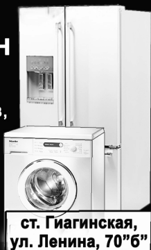
ст. Гиагинская, ул. Ленина, 70"Б"