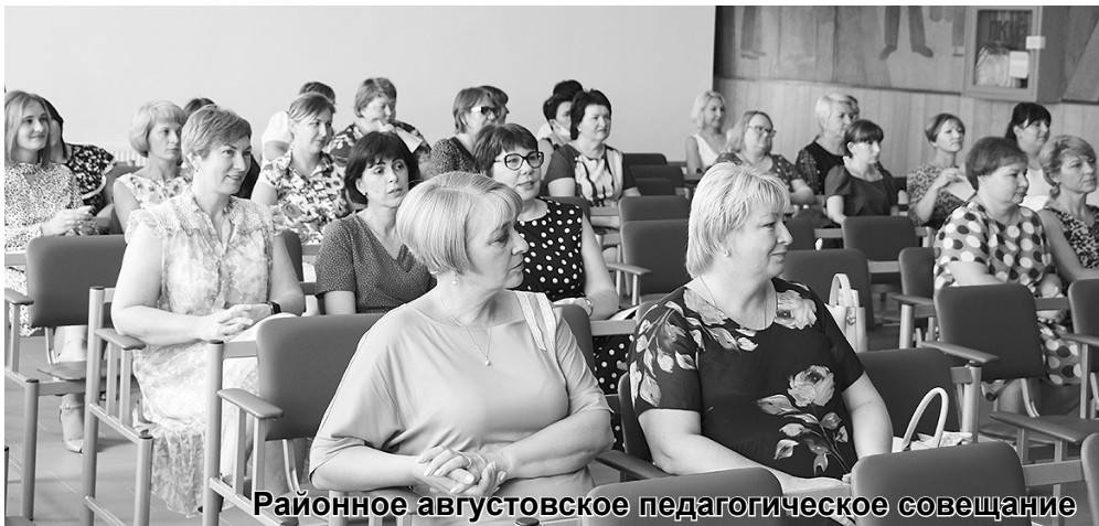
Районное августовское педагогическое совещание