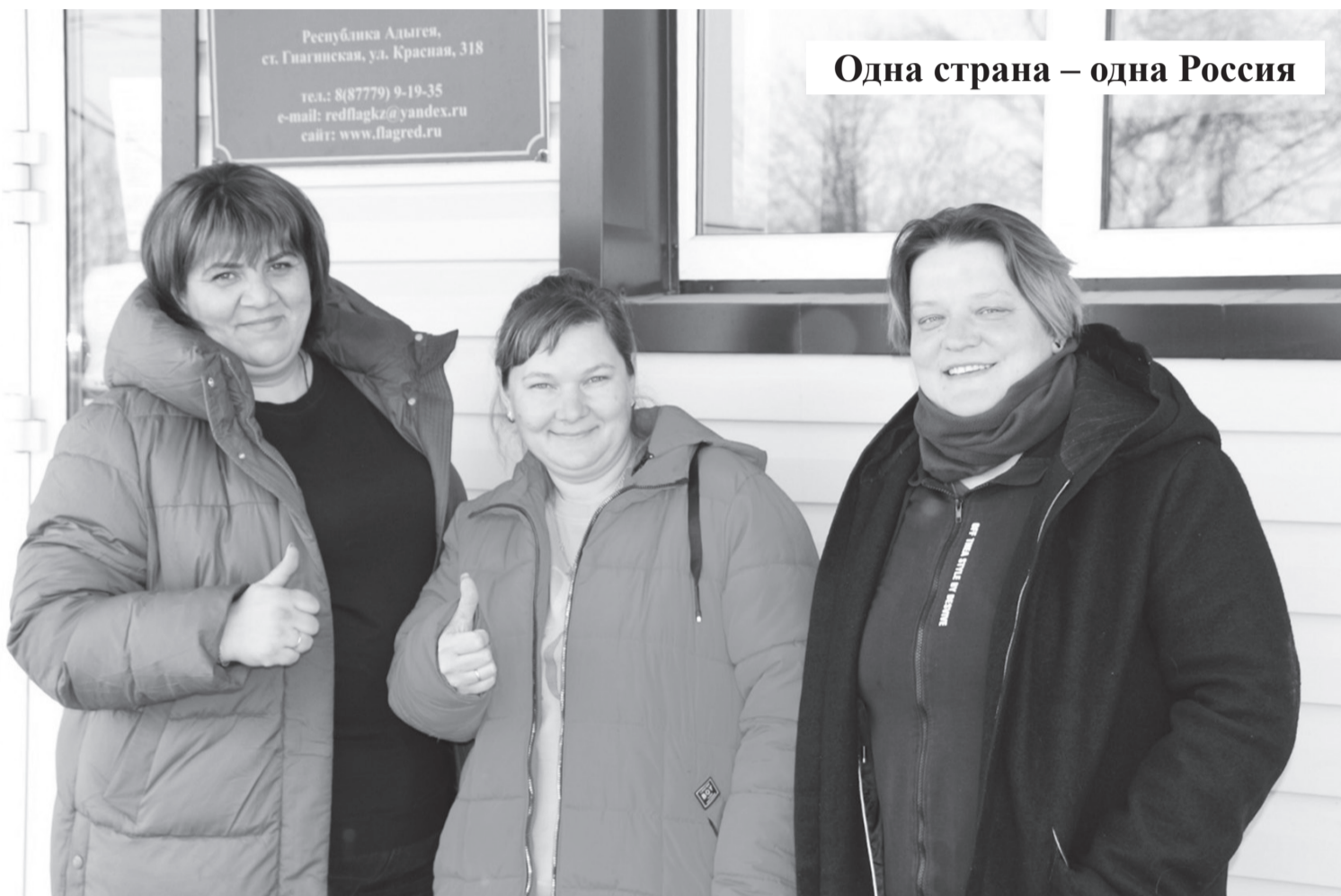
Одна страна – одна Россия

Республика Адыгея, ст. Гиагинская, ул. Красная, 318 тел.: 8(87779) 9-19-35 e-mail: redflagkz@yandex.ru сайт: www.flagred.ru