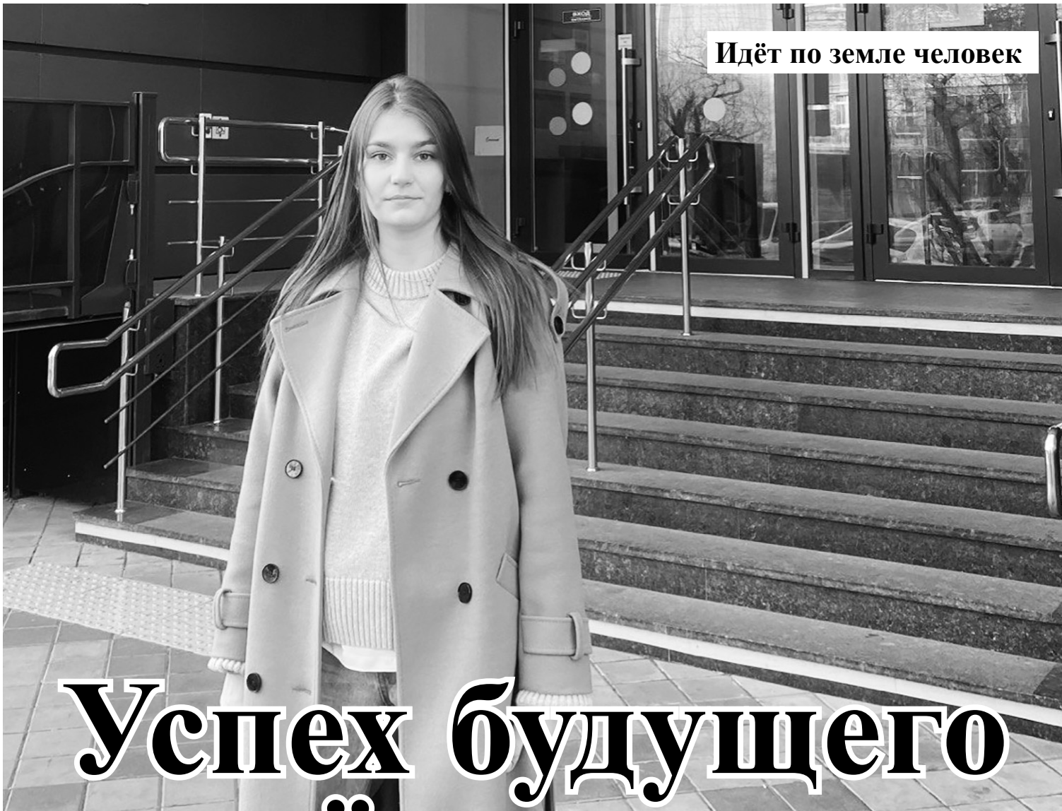
Идёт по земле человек