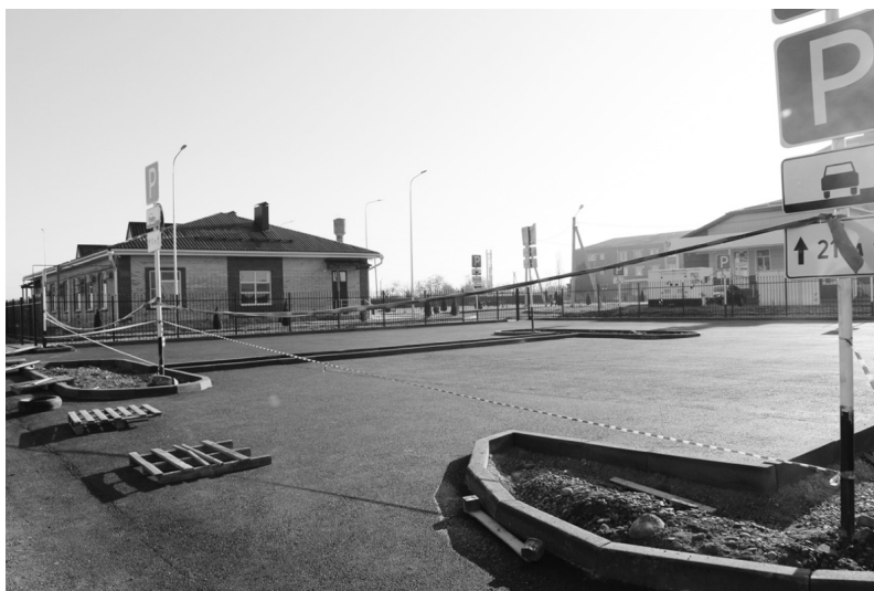
Автомобильная парковка, ст. Гиагинская (ул. Братская).

Не менее проблемным для Сергиевского сельского поселения стал вопрос незаконного пала травы в поселении. Причиной очагов возгорания снова стал человеческий фактор. Граждане, которые неоднократно привлекались к административной ответственности за несвоевременный покос травы, начи-