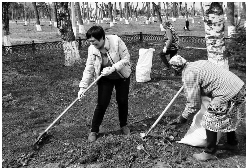
17 марта в Гиагинском районе по поручению Главы республики стартовал месячник по наведению санитарного порядка. К весенней уборке присоединились предприятия, организации, учреждения образования, культуры и жители сельских поселений.