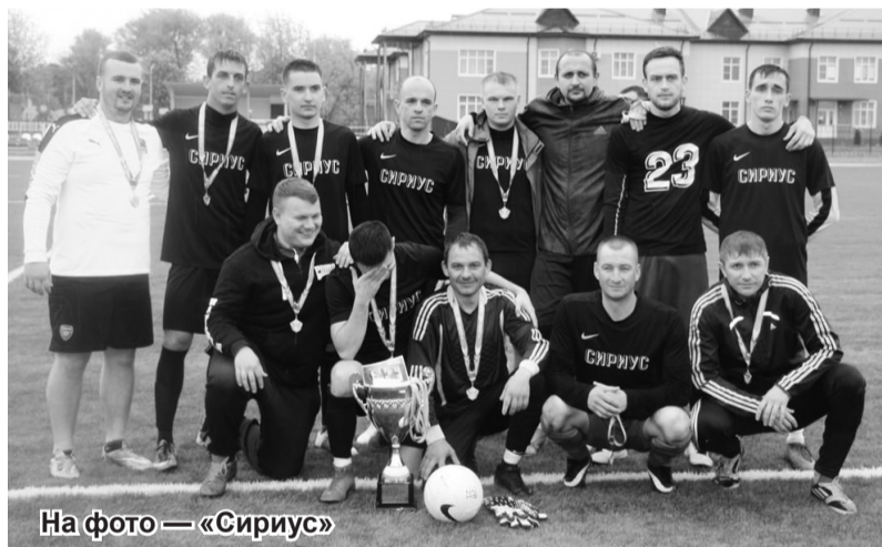
На фото — «Сириус»

В последние годы стойкость фронтовика испытывали болезни, он не мог вместе со всеми прийти и поклониться Вечному огню в День Победы. До 78-й годовщины торжества над врагом он не дожил четыре дня. Ещё один защитник страны встал в вечный строй, и память о нем мы пронесем через года. Спасибо, что были с нами всё это время, делились воспоминаниями и мудростью. Искренние соболезнования родным и близким.