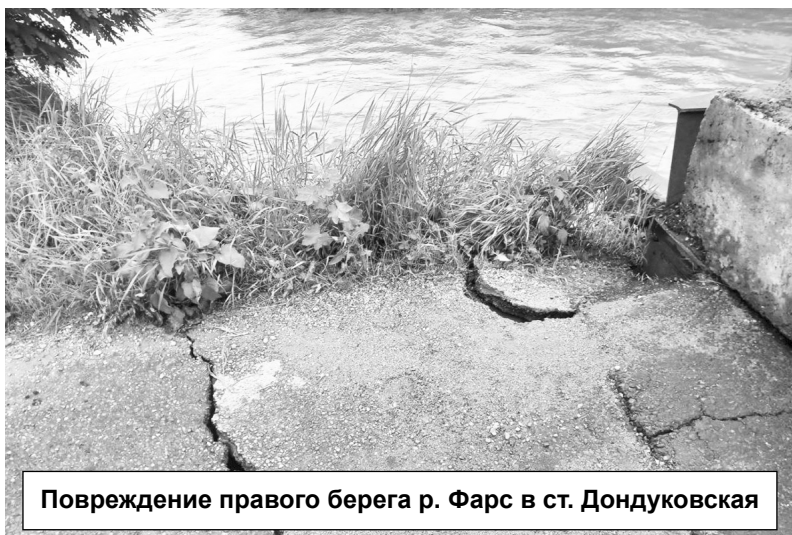
Повреждение правого берега р. Фарс в ст. Дондуковская

На них отреагировали реки, расположенные на территории Адыгеи и Краснодарского края. 6 июня до опасных явлений поднялась река Лаба, сообщил Александр Вячеславович. В 8 утра уровень воды в Лабе пошёл на спад, однако Фарс и Чехрак — малые реки, расположенные в Гиагинском районе, отреагировали некоторым подъёмом. По состоянию на 8 утра (6.06) Фарс в районе станции Дондуковской достигал отметки 3 метра 32 см.