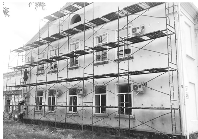
Ремонт Дома культуры в станице Келермесской