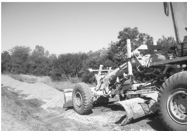
Грейдирование дороги в Сергиевском сельском поселении

— Проблема в том, что в администрации Гиагинского сельского поселения отсутствует штатный электрик. Поиск специалиста ведётся. Для исправления ситуации заключен договор со сторонним электриком. По мере набора заявок проводятся работы по