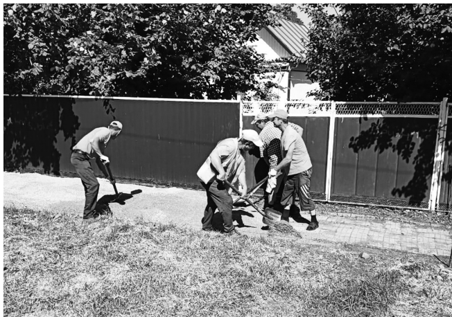
Ремонт тротуара в станице Гиагинской