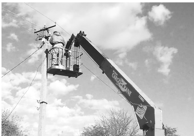
Ремонт уличного освещения в станице Дондуковской

А. МАЧУЛЬСКАЯ.