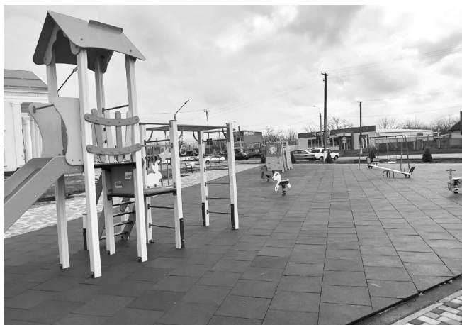
Детская площадка в сквере станицы Дондуковской