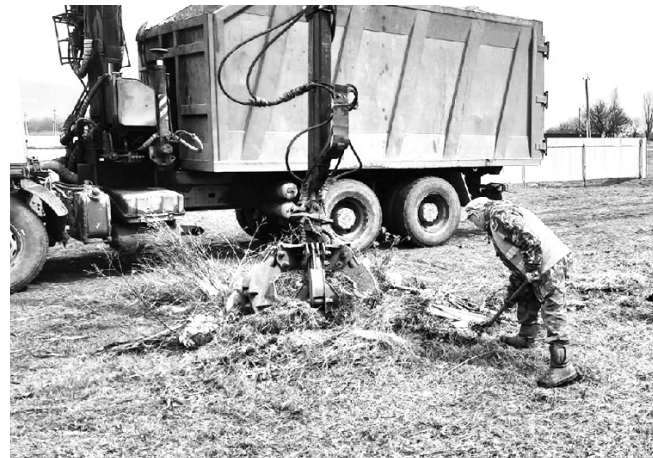
Уборка мусора на территории кладбища станицы Гиагинской