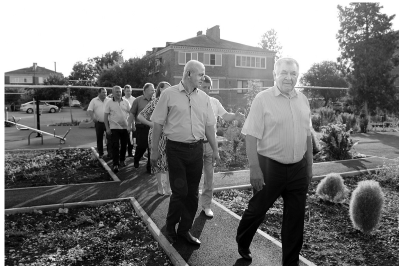
Оценка благоустройства двора по ул. Международная, 39