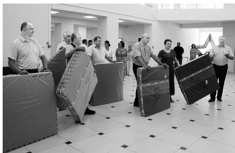
Вручение татами клубу «Самуранг»

Во дворе дома по улице Международная, 20, в рамках программы «Формирование комфортной городской среды»