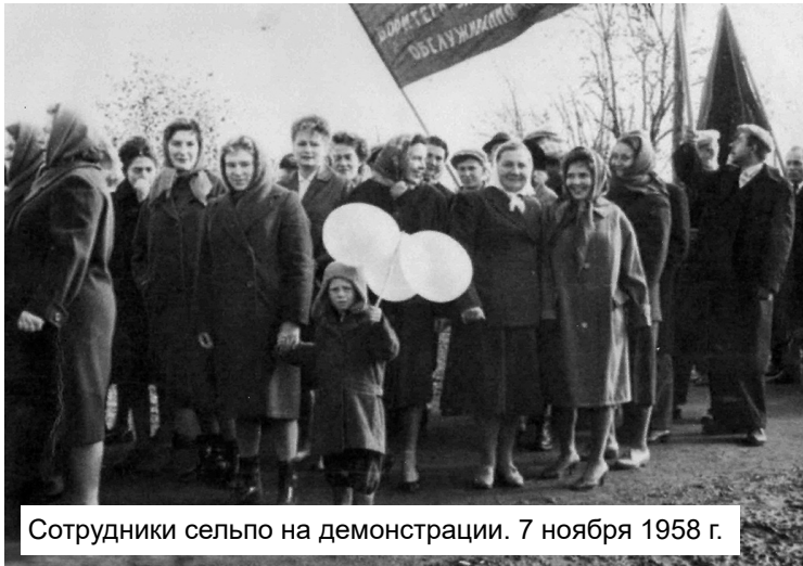
Сотрудники сельпо на демонстрации. 7 ноября 1958 г.