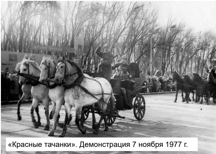
«Красные тачанки». Демонстрация 7 ноября 1977 г.