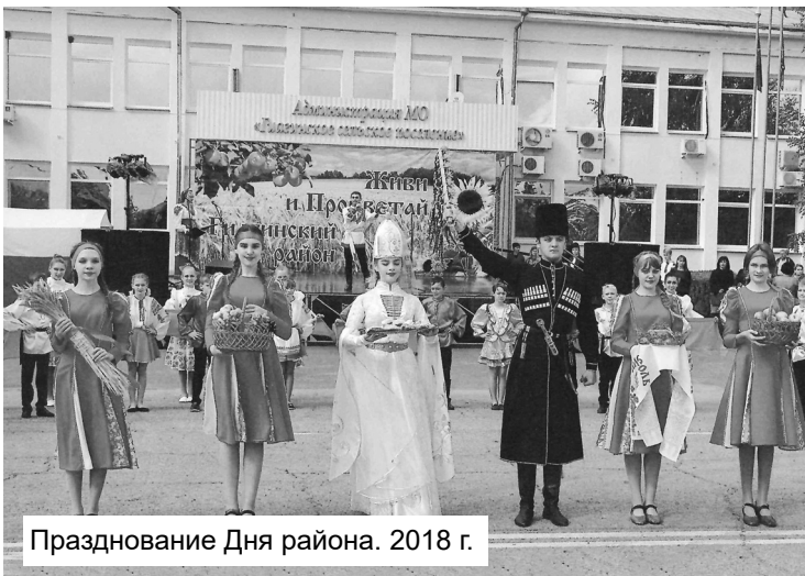
Празднование Дня района. 2018 г.