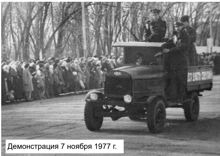
Демонстрация 7 ноября 1977 г.