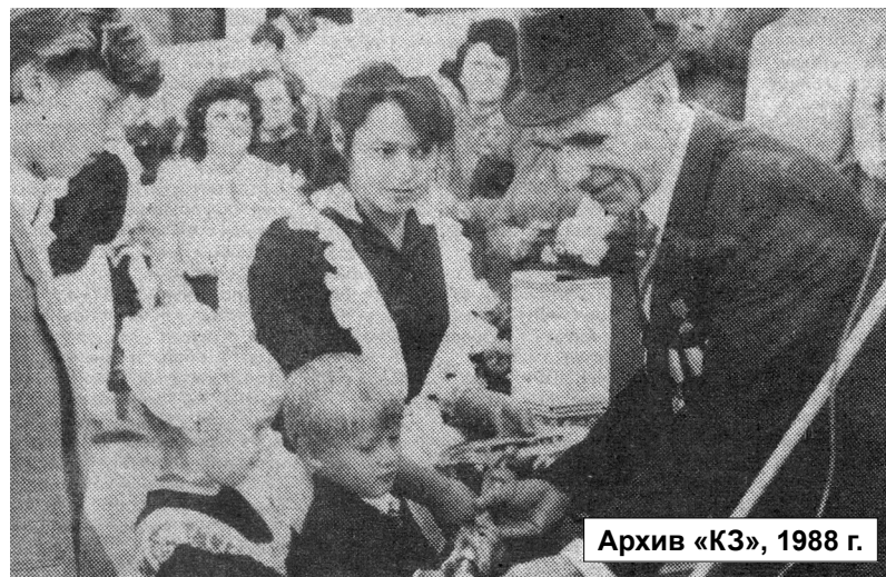
Архив «КЗ», 1988 г.