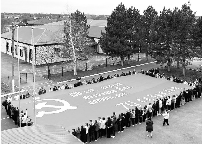
Копию Знамени Победы (200 м²) развернули во дворе школы № 4 (станция Гиагинская)

В рамках слета для педагогов и заместителей директоров прошел образовательный интенсив по обмену опытом работы с молодежью и патриотическому воспитанию школьников.