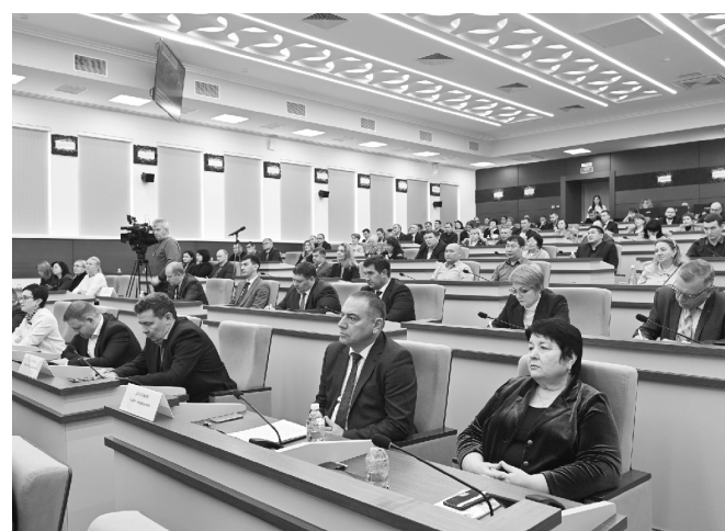
Всероссийский форум содействия развитию предпринимательства в сфере АПК