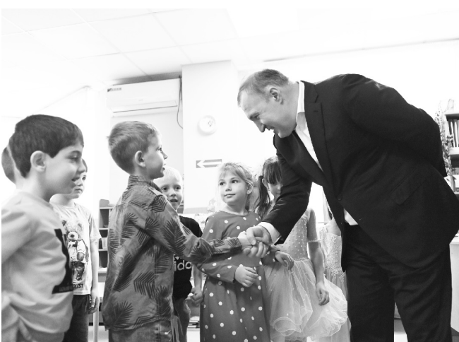
Для воспитанников детсада «Чебурашка» созданы комфортные условия