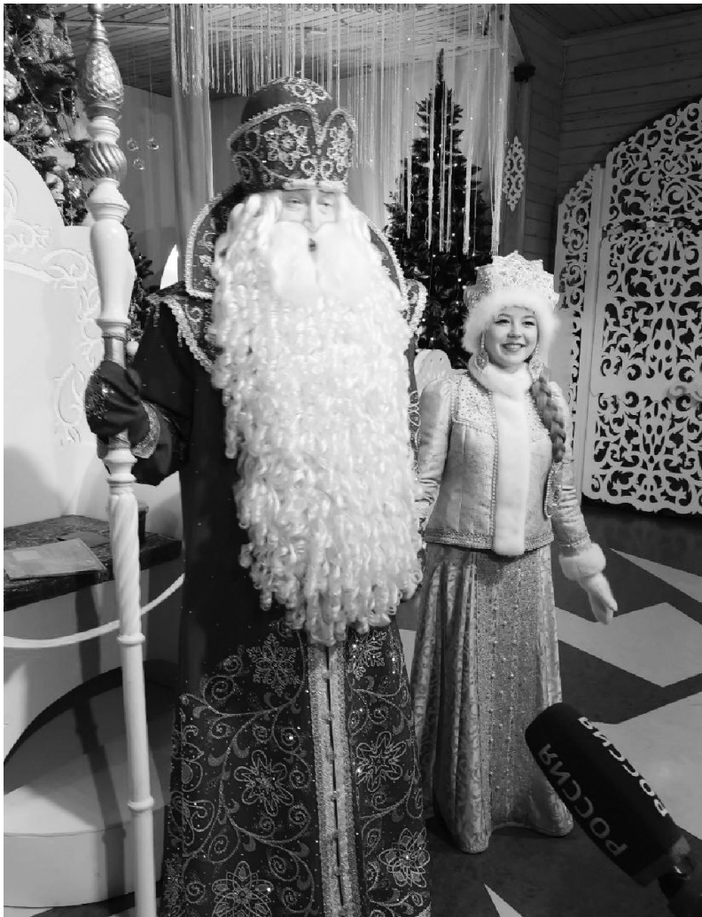
поздравление жителей Республики Адыгеи

Поздравить с наступающим Новым годом Деда Мороза лично в его вотчине в Великом Устюге! Могла ли я мечтать о таком чуде? Признаюсь, даже не смела. Но эту незабываемую сказку подарил нам, участникам пресс-тура, Всероссийский фестиваль «Моя провинция» и мультипликативный проект Вологодской области «Великий Устюг – родина Деда Мороза». Кстати, в 2023 году проекту региона исполнилась четверть века. Безмерно счастлива, что я стала частью волшебного праздника в столице «Сказочной России».