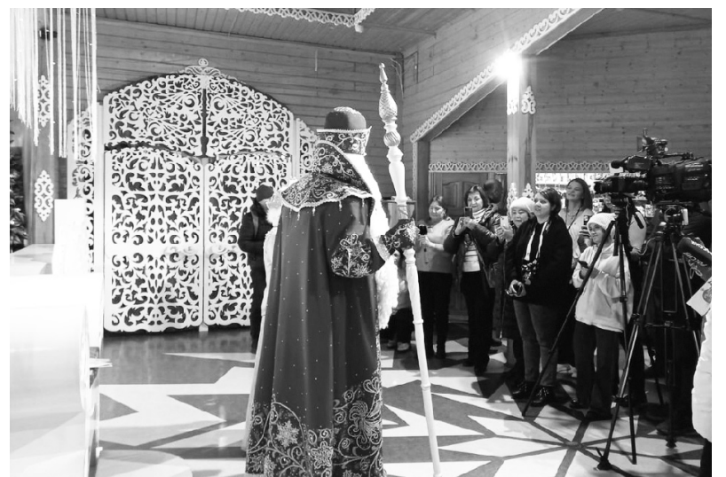
Фото: администрация г. Великий Устюг, пресс-подход с Дедом Морозом