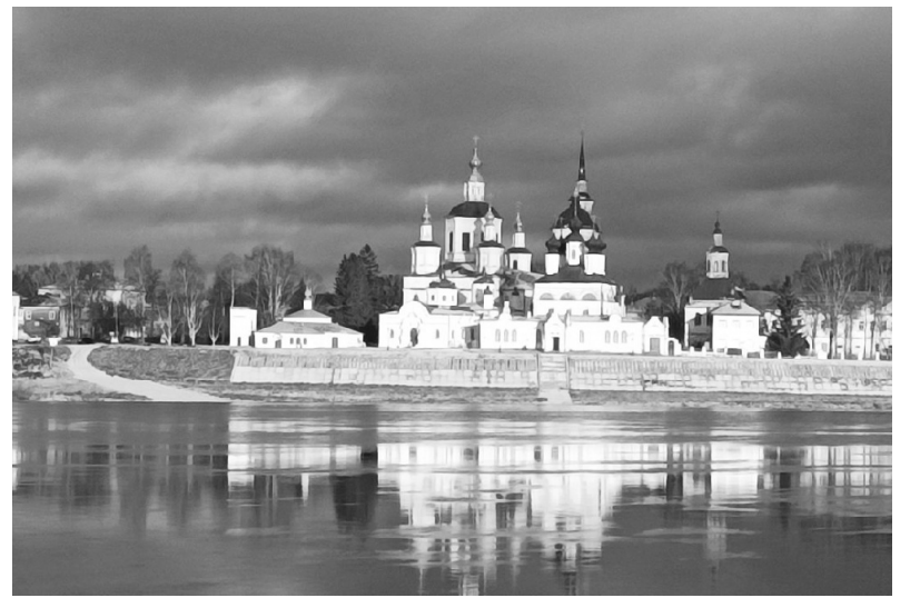
набережная реки Сухоны, Собор Прокопия Устюжского