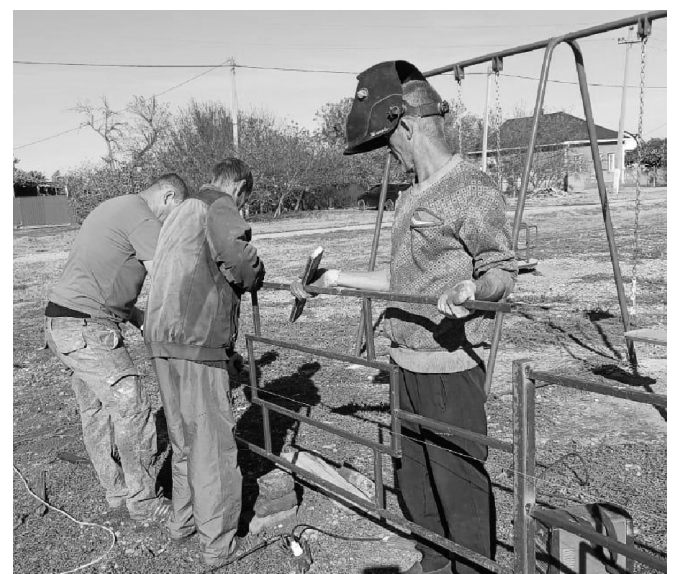
Установка ограждения детской площадки