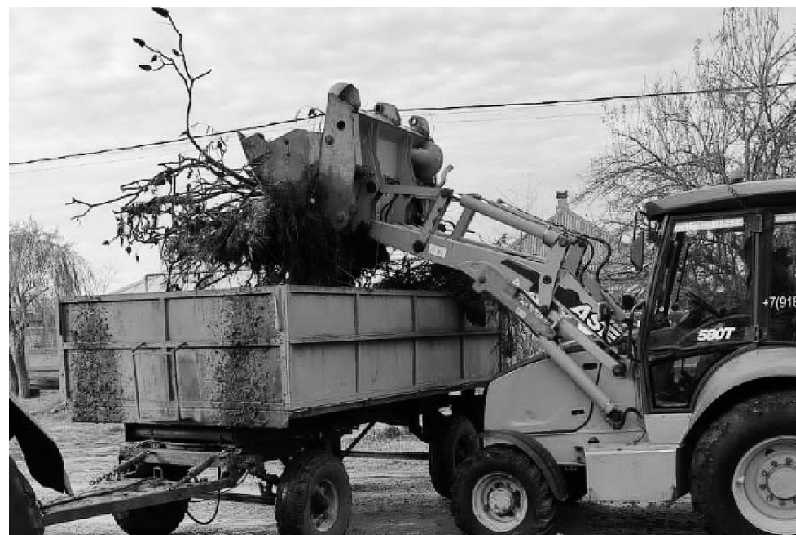
Санитарная очистка кладбища