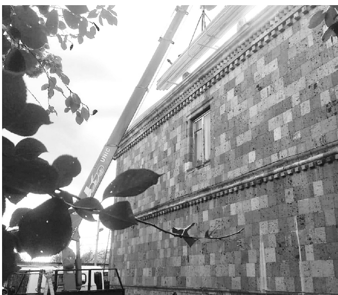
Замена кровли на здании бытового обслуживания

Дарья РОСТОВЦЕВА