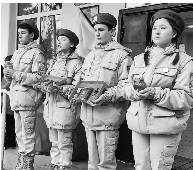
Открытие мемориальной доски в СОШ № 11