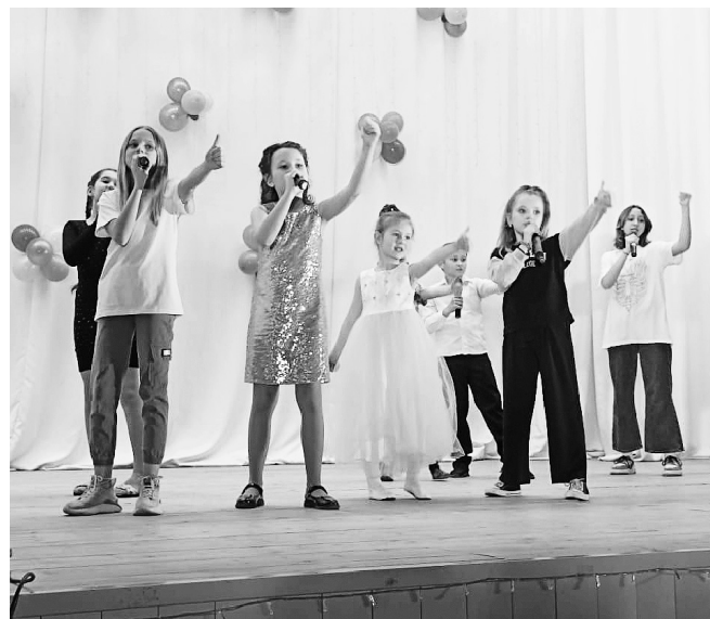
Созданы условия для творческого развития