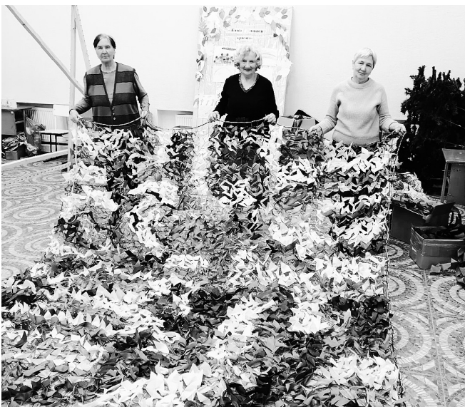
Жители помогают бойцам СВО