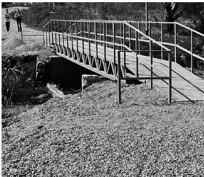
Пешеходный мост после ремонта

Алёна МАЧУЛЬСКАЯ.