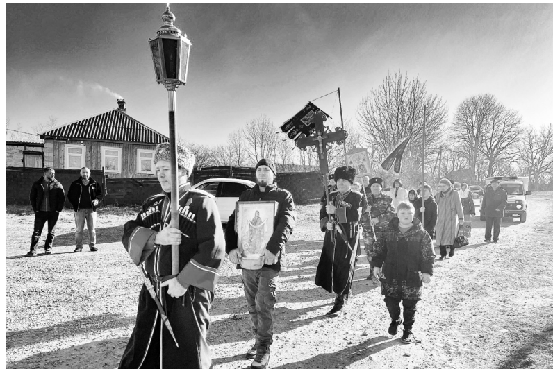
Крестный ход в честь праздника Крещения Господня