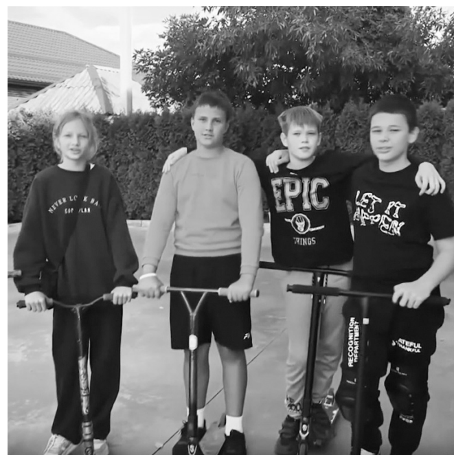
Юные жители посёлка Яблоновского