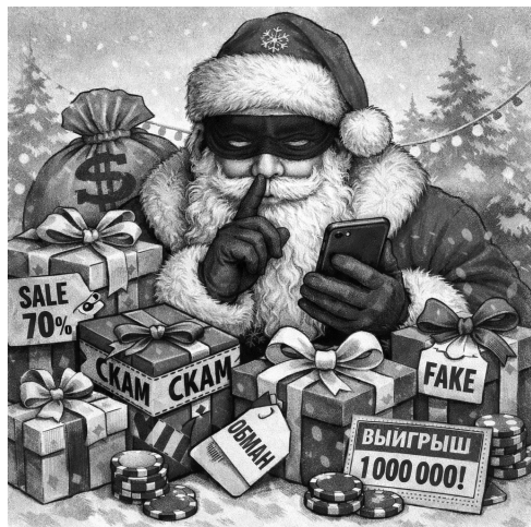
Изображение создано с помощью нейросети