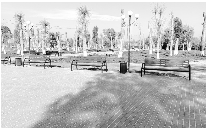
Благоустройство парка села Сергиевского, 2025 г.

В Дондуковском сельском поселении поддержана гражданская инициатива по бла-