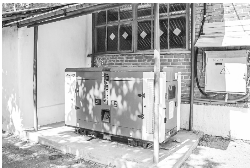
Генератор котельной улицы Международной, ст. Гиагинская

Такую задачу поставил глава региона Мурат Кумпилов на заседании комиссии по предупреждению и ликвидации чрезвычайных ситуаций и обеспечению пожарной безопасности Республики Адыгея. Это необходимо для бесперебойной подачи потребителям жизненно важных ресурсов — воды и тепла.