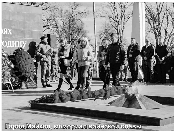
Город Майкоп, мемориал воинской славы