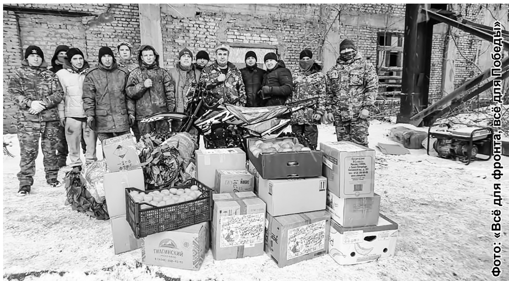
Фото: «Всё для фронта, всё для Победы»