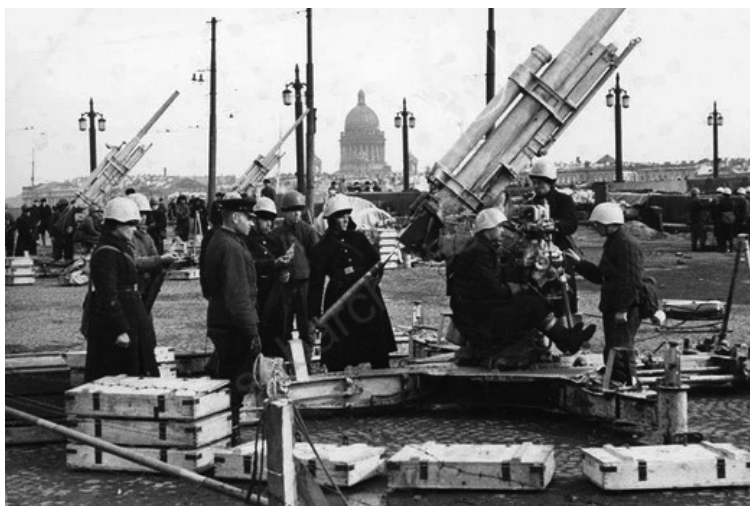
Орудийный расчёт зенитной батареи на Университетской набережной, 1942 г.

Центр общественных связей ФСБ России недавно опубликовал рассекреченные документы. В их числе — доклад немецкой разведки о положении в блокадном Ленинграде в 1942 году. В документе говорится: «Надежды на то, что весной разразится чума, не осуществились. (...) Отсутствие распространения заразы объясняется по существу высоконапряжённой работой советских учреждений в санитарном отношении. (...) В конце апреля смертность достигла приблизительно 1000 человек в день, в то время как в первые дни февраля абсолютное большинство смертности достигало 20 000 человек в день».