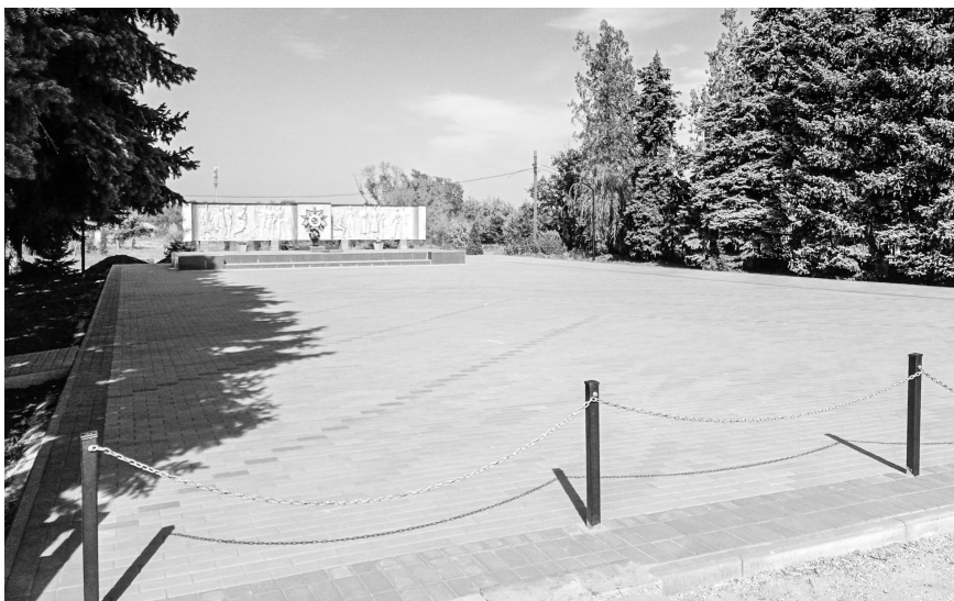
Благоустройство памятника в посёлке Новом