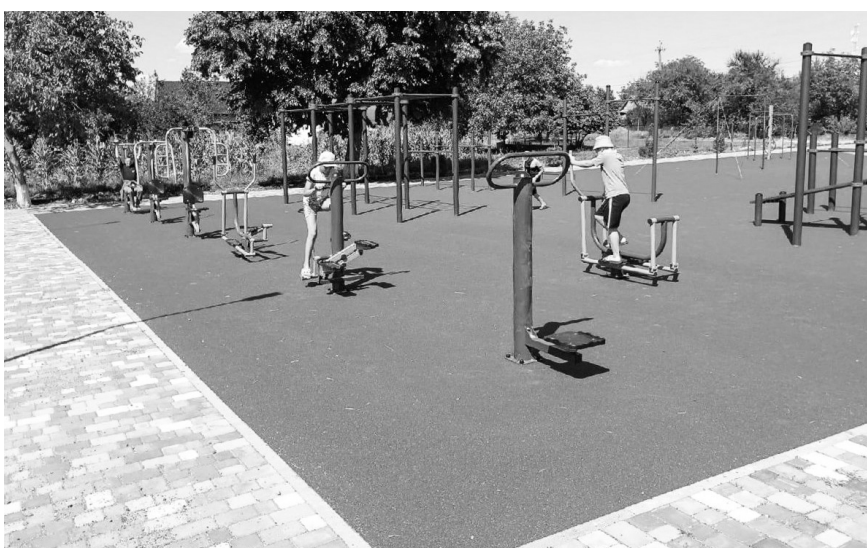
Спортплощадка в сквере имени Кирова станицы Дондуковской