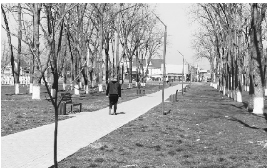
Сквер на улице Красной станицы Гиагинской