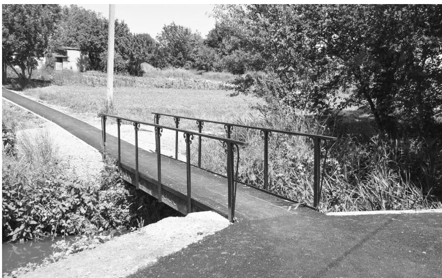
Тротуар к скверу «Солдатский родник» в станице Келермеской