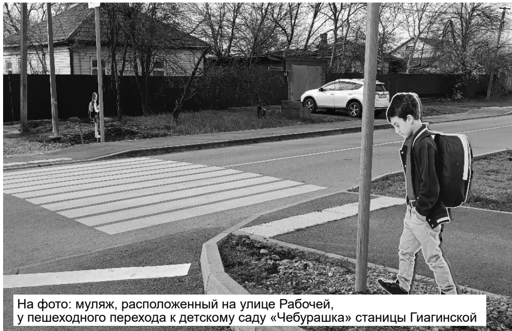
На фото: муляж, расположенный на улице Рабочей, у пешеходного перехода к детскому саду «Чебурашка» станицы Гиагинской

Наезды на пользователей средств индивидуальной мобильности — 1 случай