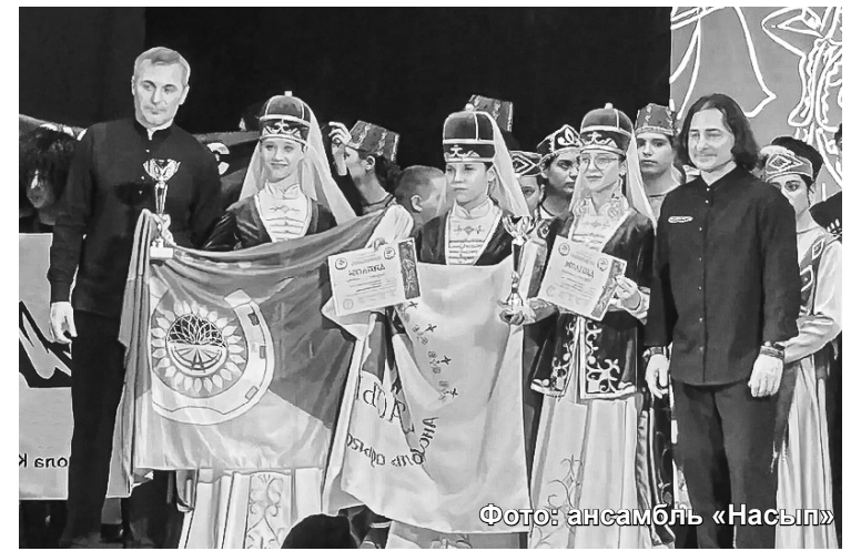
Фото: ансамбль «Насып»